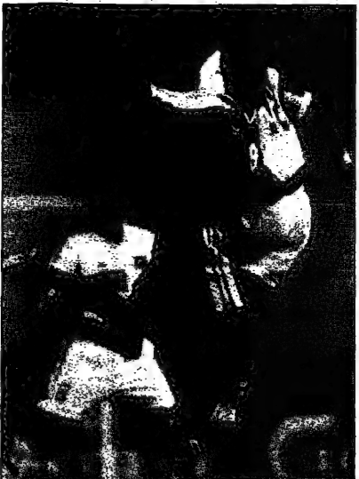
لاعب السنين في صوبي (في الوسط) يتقدم في الهواء وقابض السنين صاحب صوبي في الرجولة (اليسار)